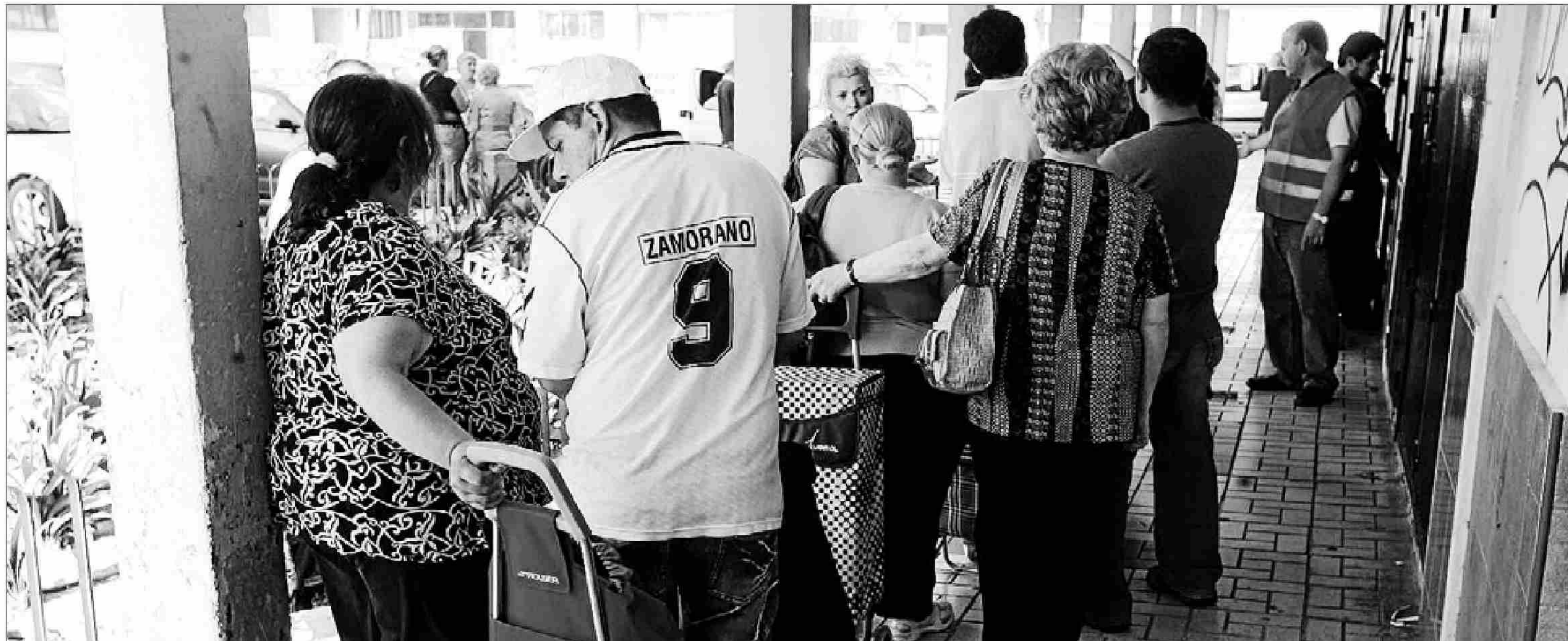
Una cola de personas ante una asociación benéfica de Málaga capital. ARCINIEGA