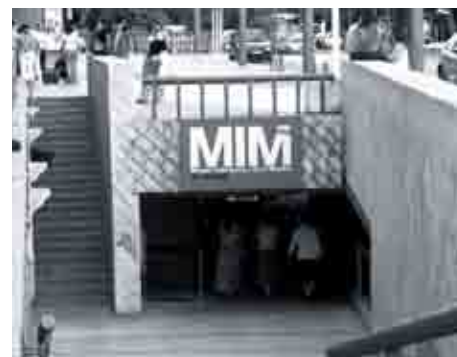
Museo Interactivo de la Música.

El ámbito de actuación ha sido en este caso el regulado por el Plan Especial de Protección y Reforma Interior del Centro (Pepri Centro), con aprobación definitiva en Sesión Plenaria Municipal de fecha 30 de octubre de 1989.