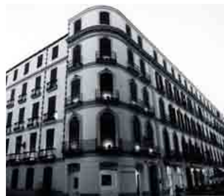
Casa Natal de Picasso, en la plaza de la Merced.

EL PLAN DE DESARROLLO TURÍSTICO-CULTURAL DE LA CIUDAD DE MÁLAGA SUPUSO PARA MÁLAGA LA APUESTA DECIDIDA POR EL TURISMO CULTURAL DE CALIDAD