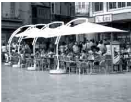
Terrazas en la plaza de la Constitución.

Las actuaciones que han recibido subvención en el marco de este proyecto son las siguientes: