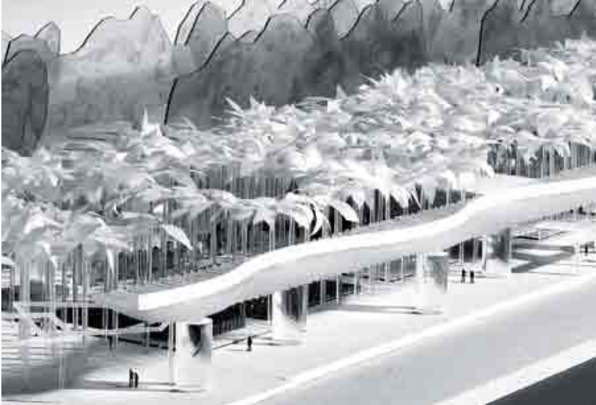
Futuro aspecto del Palmeral de las Sorpresas.