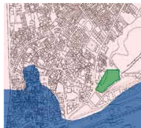
La Málaga fundacional se asienta en la ladera de Gibralfaro.

La cultura y permanencia romana desde el siglo III antes de la era cristiana hasta bien entrado el siglo IV no nos han creado un sentimiento de "procedencia" ... Siete siglos latinos, un teatro, unos ciudadanos no sometidos por la fuerza, sino por el convencimiento de ser regidos por unas leyes propias, la LEX FLAVIA MALACITANA, de las que se guarda un excepcional testigo en