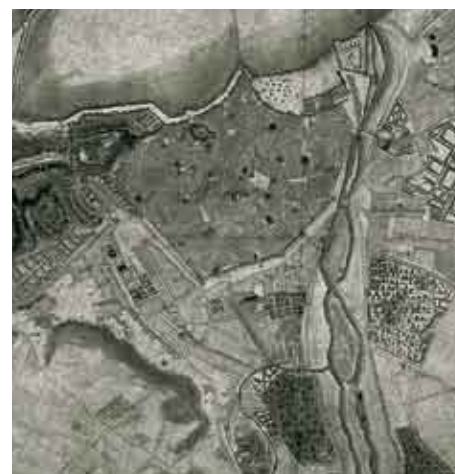
Plano de Bartolomé Thurus. 1717.