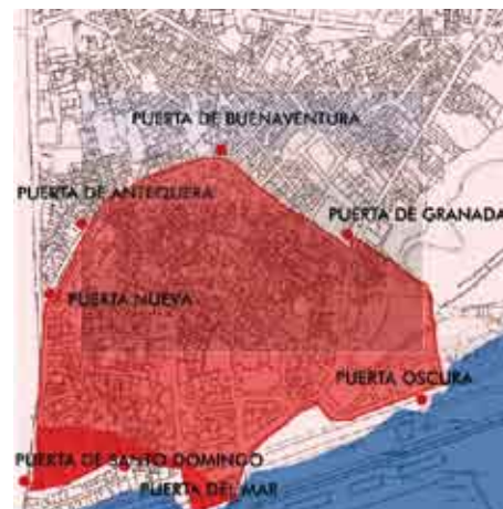
Las puertas de acceso a la ciudad.