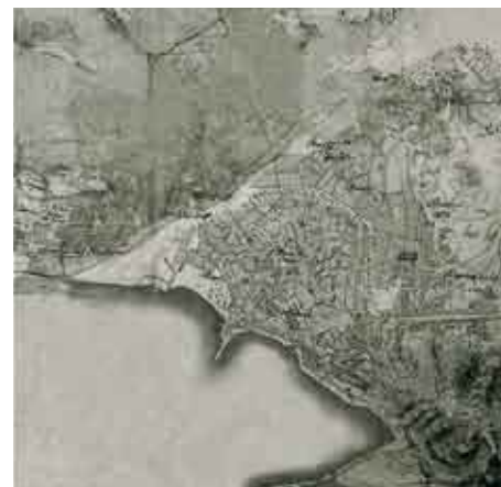
Plano de la ciudad. 1700.