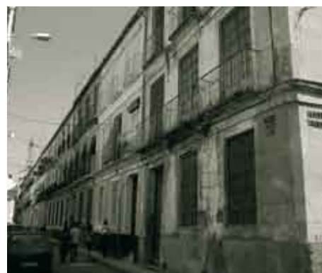
Actuaciones inmobiliarias en solares procedentes de la desamortización.

LA BURGUESÍA SE INSTALA EN CALLES HECHAS A SU MEDIDA