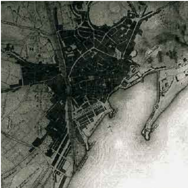
Plano de Antonio de Mesa, 1863.