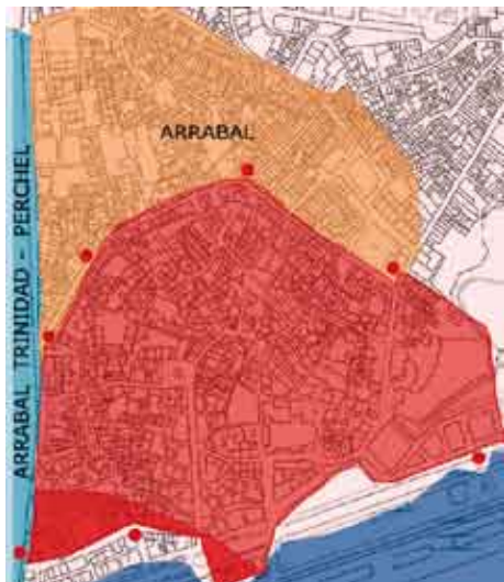
La medina amurallada Nazari del siglo XIII.