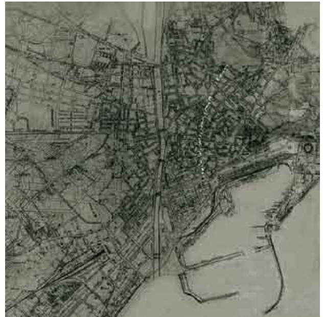
Plano de finales del siglo XIX.