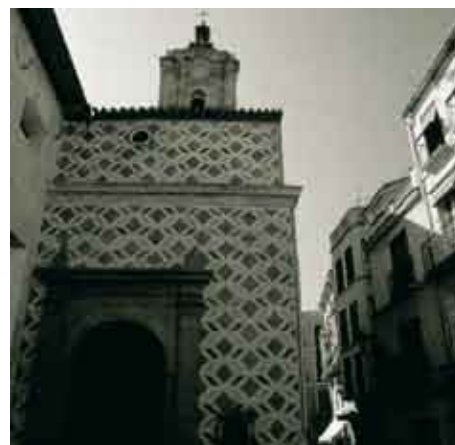
La Iglesia de San Juan antes y después de la recuperación de las pinturas de su fachada llevada a cabo por la Oficina de Rehabilitación.

LOS PROCEDIMIENTOS, LA METODOLOGÍA, LAS TÉCNICAS EMPLEADAS EN LA EXPERIENCIA DE MÁLAGA HAN SIDO RECONOCIDAS EN FOROS INTERNACIONALES