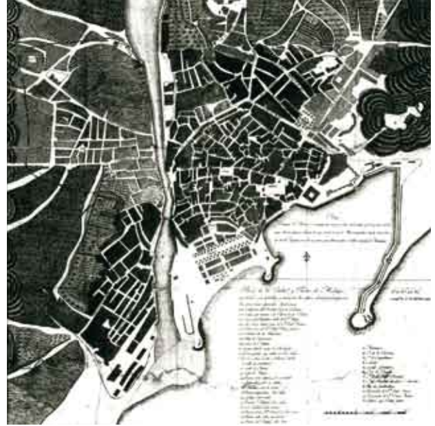
Plano de Onofre Rodríguez, 1805.