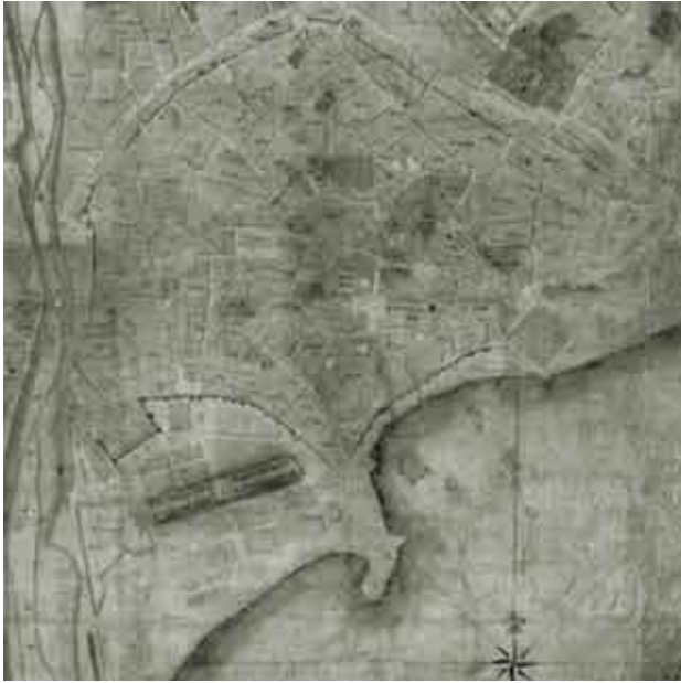
Plano de Carrion de Mula, 1791.