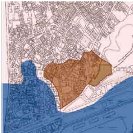
La Málaga romana.