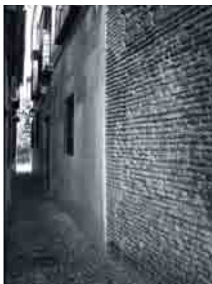
El proyecto final transformó el deteriorado aspecto de las calles adyacentes.