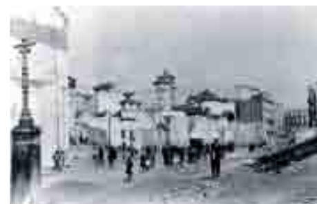
Obras de ampliación de calle Alcazabilla, 1932.