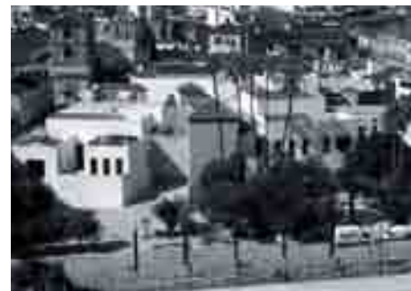
Antes y después de la intervención.