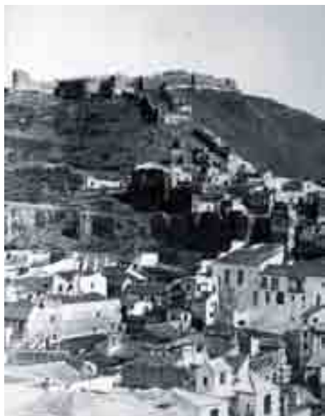
Castillo de Gibralfaro, finales del siglo XIX.