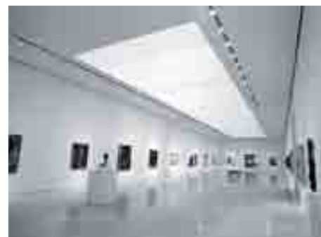
Interior del Museo Picasso.