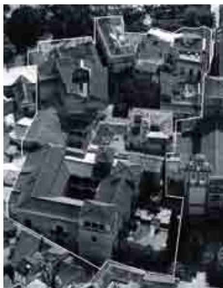
El proyecto final integró edificaciones colindantes al palacio.

dos de madera han contribuido a mantener a lo largo del tiempo. La entrada se realiza por la misma puerta principal aunque se modifica la posición de la escalera para conseguir un espacio de acogida más amplio, cambiándose la entrada directa al patio por una en recodo, solución que tiene apoyaturas en la tradición andaluza.