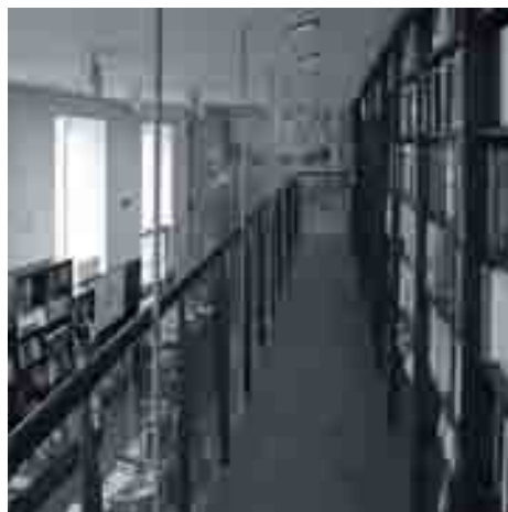
Interior de la librería Proteo. Al fondo, los restos de la Puerta de Buenaventura.

La sustitución de edificaciones en el casco histórico permite la investigación arqueológica de los solares, con lo que se va recomponiendo la historia de la ciudad. En algunos lugares estas piezas de arqueología afloran a la superficie, como trazos que refieren a otras épocas y que explican la evolución de la estructura urbana. El fragmento de la muralla de la medina musulmana que se ha conservado entre las calles Muro de San Julián y Carretería es muy elocuente, entendiéndose bien el trazado de estas calles apoyado en la muralla. En este caso se ha demolido una edificación para dejar el muro a la vista, justificándose plenamente la ruptura que se produce por el valor de lo descubierto, no solo desde el punto de vista museístico sino como referencia a la historia de la ciudad. El mismo caso es el trozo de muro de la puerta de Buenaventura, la antigua Bab-el-Jawja que era una de las puertas de la muralla