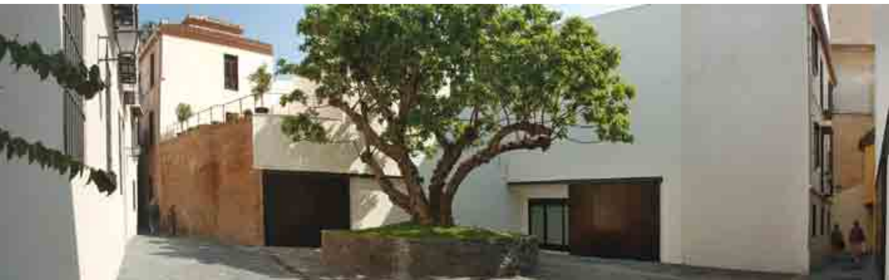
Plaza de la higuera.