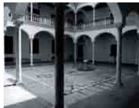
Aspecto anterior del patio porticado.

EL BIEN A CONSERVAR ES EL PROPIO CONJUNTO HISTÓRICO FORMADO POR LA SUMA DE TODOS SUS EDIFICIOS