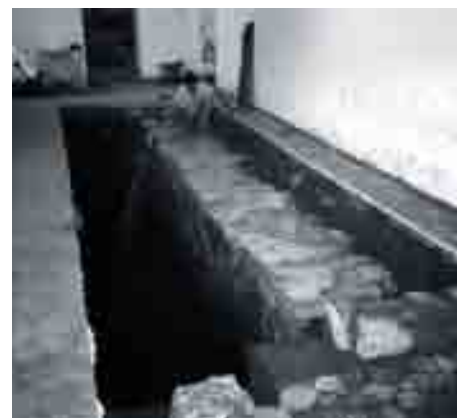
Dos años duraron las excavaciones realizadas en el Palacio de Buenavista.

APROVECHANDO UN SOLAR VACÍO EN EL QUE DESDE HACE TIEMPO HA CRECIDO UNA HERMOSA HIGUERA SE CREA UNA PLAZA QUE SE CONVIERTE EN CENTRO DE TODA LA ACTIVIDAD CULTURAL DEL MUSEO