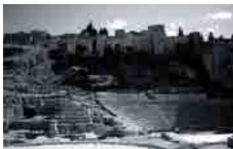
Teatro Romano y Alcazaba.