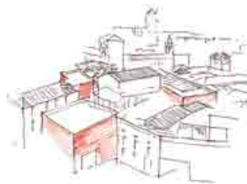
El entorno del museo.

En estas rehabilitaciones se ha seguido en todo caso el criterio de la mínima intervención. No se ha tratado de recuperar la imagen prístina, original, del edificio, ya que éste ha sufrido transformaciones a lo largo de su historia que forman parte ya del mismo. Ha sido, pues, una intervención más, que como aquellas, sin alterar su esencia sino, al contrario, con la idea de mantener y potenciar su originalidad y sus valores ha tenido el sentido de adaptarlo a nuevas circunstancias. Estas operaciones, realizadas para ir adaptando el edificio a necesidades cambiantes no lo han desvirtuado ni han supuesto modificaciones esenciales y sí han mantenido su utilidad, lo cual ha favorecido su conservación a lo largo del tiempo.