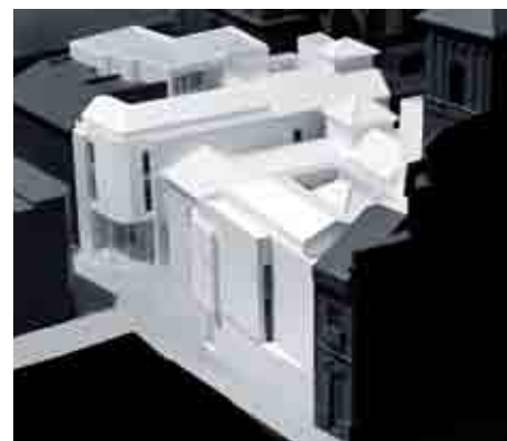
Maqueta del futuro museo.