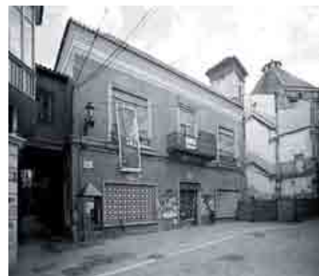
El Palacio de Villalón antes de su restauración.

El proyecto de rehabilitación del Palacio de Villalón y su entorno apuesta por la recuperación y la puesta en valor de esta edificación del s. XVI, proceso que ya se inició con la restauración de sus armaduras y cubiertas, recuperando su traza histórica de acuerdo con los análisis y estudios realizados. Para ello, se vuelve a formalizar el patio completando el frente oeste desaparecido; se recupera la presencia de arcadas y columnas de mármol ocultas o desaparecidas, según los casos; se rehace la galería de planta primera de acuerdo con los vestigios encontrados y siguiendo el modelo de edificaciones similares de