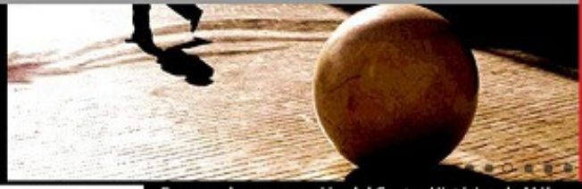
Proceso de recuperación del Centro Histórico de Málaga