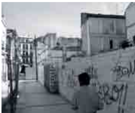
Algunas áreas del centro presentan un aspecto muy degradado.

El proceso de degradación de amplias zonas del Área es acelerado, tanto como el ritmo de demolición de inmuebles. En las propuestas de actuación de los Avances se justifica una fuerte inversión pública en los distintos programas del Plan Andalúz durante el primer bienio, como motor de arranque para incitar a la participación posterior de la iniciativa privada. Es decir, en la situación en la que se han redactado los Avances, incluso en la revisión y actualización de los mismos en las fechas próximas del 2002, se daba por hecho una absoluta atonía del mercado que necesitaba ser estimulado por la confianza de una actuación pública de arranque. La realidad, sin ser del todo la contraria —sobre todo en determinadas zonas— es, sin embargo distinta. La carencia de suelo periférico al alcance de pequeños promotores por un lado, la ya re-