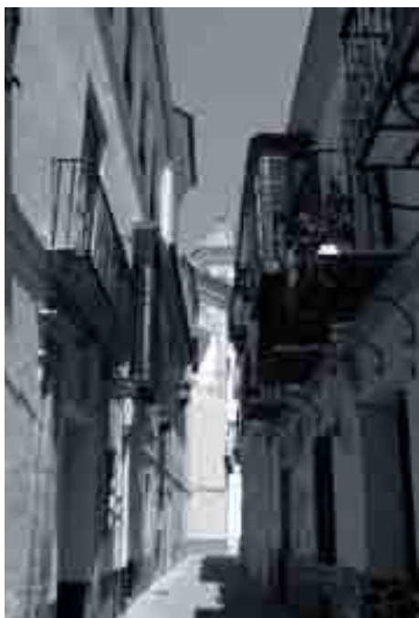
Se quiere actuar sobre calles de alcance que crean recorridos.

de revitalización y reestructuración urbana, más allá de su estricto servicio, en otros. Sería preciso, no obstante, determinar su idoneidad y prioridades de acuerdo con una visión de conjunto, para evitar concentraciones y desequilibrios. Existen operaciones de equipamiento escolar, por ejemplo, cuya repercusión trasciende los límites del área en la medida en que ellas permiten liberar suelos del Centro intramuros inadecuadamente utilizados para ese fin. Algunas de las piezas urbanas reservadas para equipamiento son ya de propiedad institucional, incluso del propio Ayuntamiento de Málaga, como es el caso de la sede de la Policía Local y las antiguas naves de la Cooperativa Farmacéutica. Sin menoscabo de otras piezas de titularidad privada cuya obtención se estime prioritaria, la titularidad ya pública de esas instalaciones permitirá derivar esta línea de actuación hacia la obtención de suelo para viviendas públicas, consideradas éstas como equipamiento.