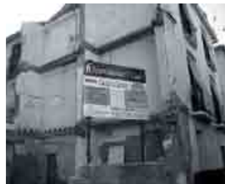
Solares en venta.

Dadas las particularidades de la zona, con la existencia de inmuebles de alto valor patrimonial —de los que seguidamente hablaremos con una línea específica— se fomentará la modalidad de Rehabilitación Singular y la de Rehabilitación de Edificios.