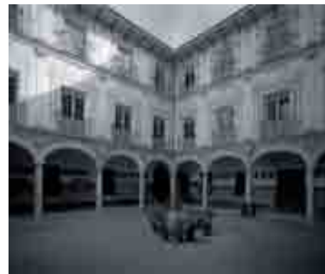
Patio del Instituto Vicente Espinel, en calle Gaona.

EN TODOS LOS AVANCES SE HA HECHO ESPECIAL HINCAPIÉ EN LOS DISTINTOS PROGRAMAS DE TRABAJO SOCIAL