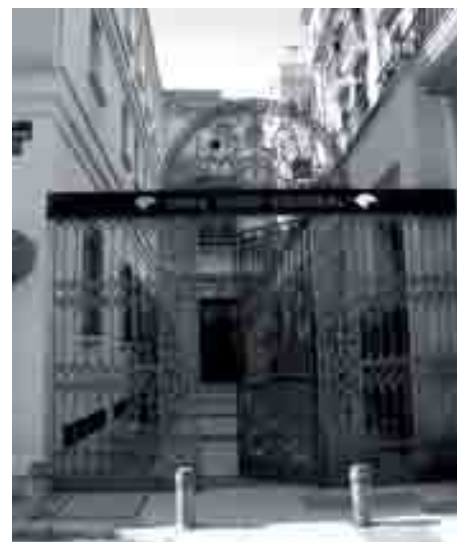
Conservatorio María Cristina.