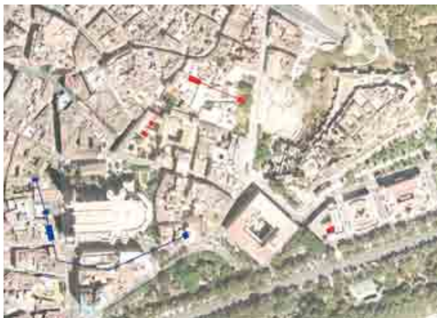
Hipótesis sobre los trazados de la muralla de Malaka (s. VI a.n.e.) y Malaca (s. III d.n.e.) basada en el registro arqueológico.

Archivo: Sección de Arqueología, Gerencia Municipal de Urbanismo.