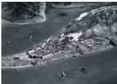
La ciudad fenicia y púnica. El proceso de asentamiento. Infografía: Arketipo, S.C.A. Publicada en "Málaga y su provincia. Ayer y hoy". Guía Fácil. Ediciones Ilustres S.L.

tectos, promotores y administraciones) facilitando la información disponible. En primer lugar valorando lo que existe, indicando dónde y cómo se encuentra, para establecer que puede aportar el estudio de la evolución de esta ciudad al conocimiento histórico, cómo alcanzarlo y en qué medida debe contribuir ese Patrimonio a hacer Ciudad mediante su puesta en valor.