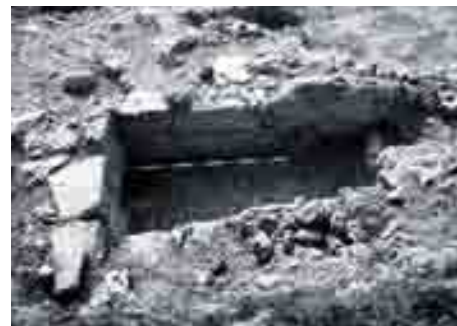
Estructura funeraria 6, Excavación calle Campos Elíseos, Necrópolis de Gibralfaro, Málaga, 1998. Directores: J.A. Martín Ruiz y A. Pérez-Malumbres Landa.

A grandes rasgos se puede asegurar que su decurso aprovecha dos relieves geo-estructurales de rango elevado: por una parte la cota dominante que constituye la elevación calcofílica que sirve de asiento a las actuales Alcazaba y Gibralfaro, y de otro lado la dorsal filítica que discurre longitudinalmente desde la Parroquia de Santiago hasta la Catedral. Aún se conserva la