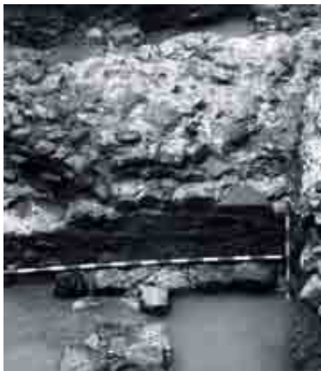
Detalle de alzado de la muralla. Excavación en la Plaza del Obispo, Director: Ildefonso Navarro, 1998.

za y Palacio del Obispo, donde las fechas de edificación se reiteran en torno a las postrimerías del siglo III y el IV. Su confluencia, prolongando hipotéticamente su trazado vendría hacia calle Strachan, aunque no aparecen indicios de sus lados norte y este, desconociendo aún el perímetro urbanizado.