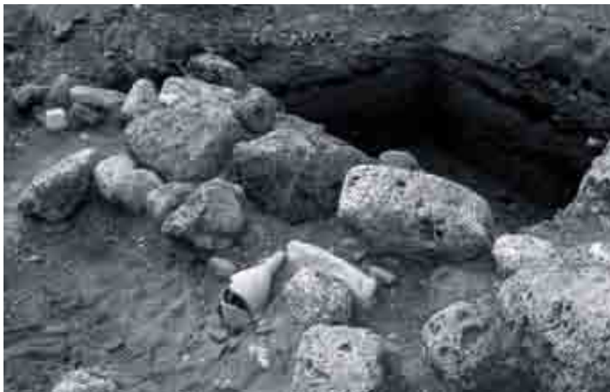
Alineación de sillares del fondeadero aparecido en solar entre calles Marqués y Camas. Excavación para el aparcamiento de calle Camas. Directora: Carmen Iñiguez, 2000.

Al Oeste, rebasado el flanco de la muralla romana delante de la Catedral, se disponen por la Plaza del Obispo, 34 Molina Larios y Strachan las naves comerciales donde se almacenan y exportan las producciones locales y se reciben las importaciones orientales. Ello concuerda con el límite marítimo para la línea de costa en torno a calle Ancla, siendo límite oeste al fondeadero puesto al descubierto en Camas.