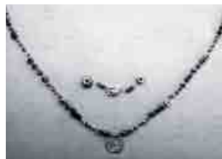
Piezas del collar del ajuar funerario. Tumba de incineración de inicios del siglo VI a.n.e.