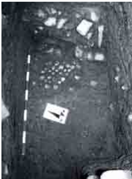
Pavimento de conchas en solar de calle San Agustín 6. Director 1ª fase: A. Cumpian Rodríguez, 2001.

¿Cómo se caracteriza el espacio intramuros? La disposición de la cerca urbana modifica la orientaciones de las plantas a partir del siglo VI, y a ella deberán acomodarse tanto los edificios como los viarios. Aunque no podamos avanzar aún la conformación del parcelario interno y su red de tránsito, si nos orientamos con las técnicas constructivas: Paramentos con zócalos de mampostería careada y calzos de ripio, trabados con barro, que elevarían su alzado con fábricas de tierra (tapiales) y profusión de adobes en los pavimentos, que prestan el hermoso colorido de las arcillas a las construcciones (verdes, amarillo, anaranjados...) si bien condicionan una enorme vulnerabilidad en la conservación y exposición exenta de los restos.