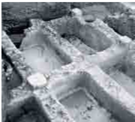
Piletas de la factoría de salazones de calle Cerrojo. Excavación en calle Cerrojo 24–26. Director: Gonzalo Pineda, 1999.