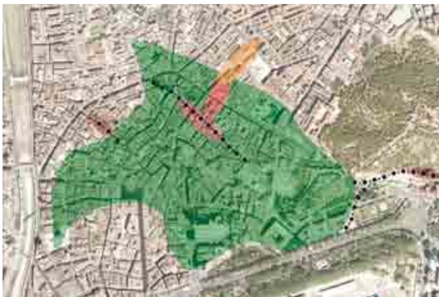
Ciudad consolidada a inicios del siglo VI d.n.e. Desplazamiento de áreas funerarias al exterior desde su origen, marcado por las vías de acceso.