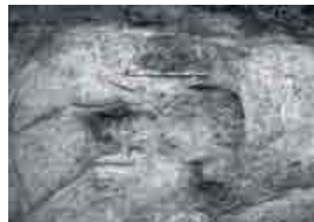
Tumba de incineración de inicios del siglo VI a.n.e. Excavación en calle Tiro 3-9, Málaga, 2005. Director: Francisco Melero García.

Se complementa, en parte, la explicación de ese proceso con datos aparecidos bajo el antiguo edificio de Correos, 8 documentando niveles constructivos fenicios. Nos interesa destacar que “El depósito de material asociado, muy