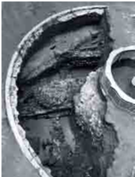
Imagen en planta de la muralla romana del siglo III d.n.e. bajo la fuente de la Plaza del Obispo. Sesgada sobre ella aparece la cubierta del Acueducto de San Temo, que la abastecía. Excavación en la Plaza del Obispo, Director: Ildefonso Navarro, 1998.