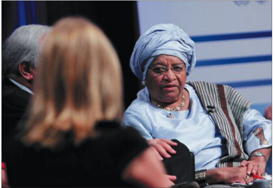
La presidenta de Liberia, Ellen Johnson Sirleaf, durante un debate en la conferencia de Oslo.

El paro será el mayor problema económico de los próximos años, una vez que la recesión, esta vez sí, está encauzada y que la mayoría de los países crecen ya; algunos tímidamente —los avanzados— y otros a toda velocidad: China, India y Brasil están disfrutando de una poscrisis muy provechosa, con crecimientos en torno al 10% del PIB e incluso indi-