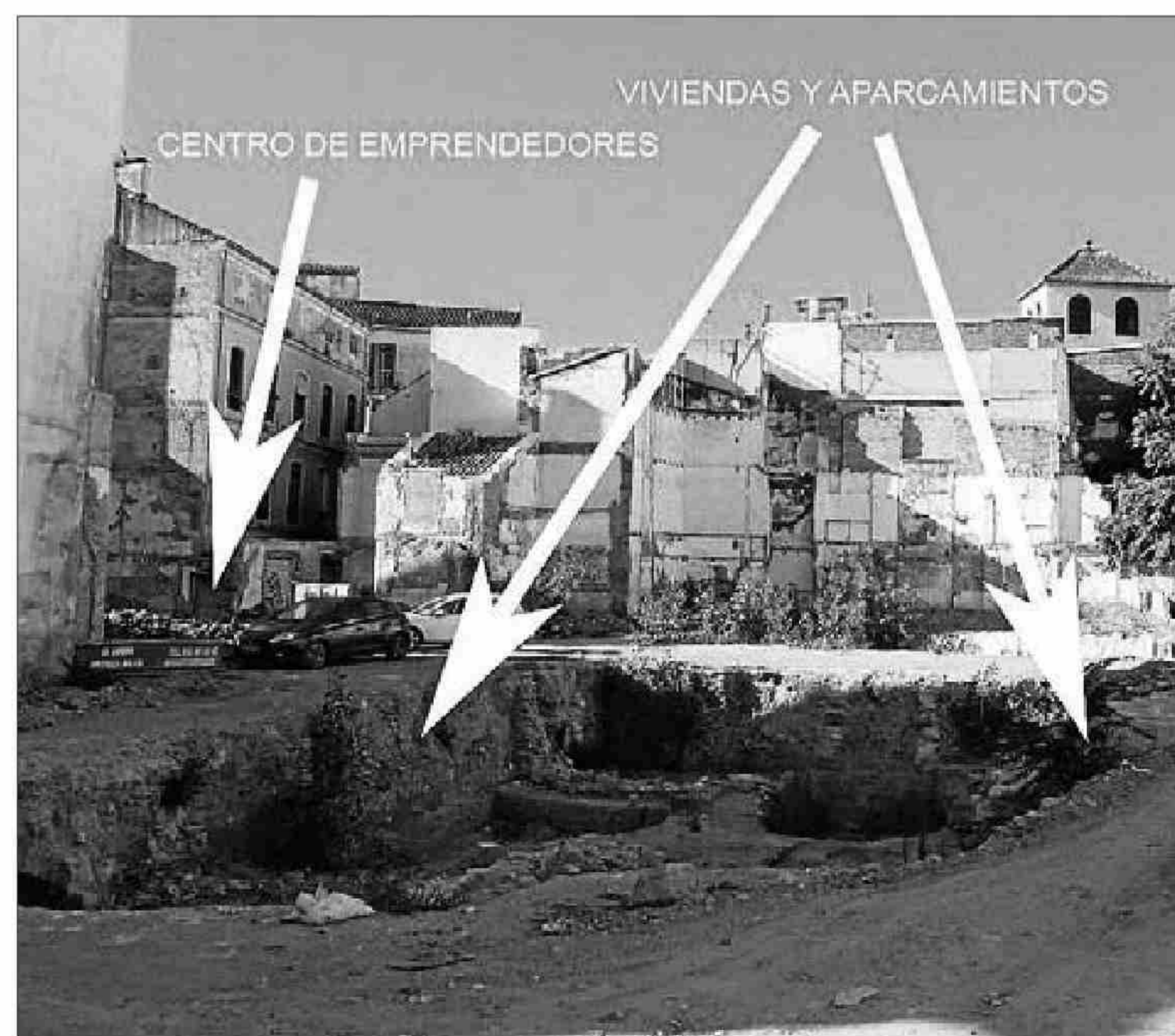
Distribución del proyecto de la calle Nosquera. LA OPINIÓN

En la parte sur de la parcela se desarrollará un centro de emprendedores, siguiendo el modelo de incubadora de empresa. En los bajos se desarrollará una actividad comercial relacionada con la artesanía.